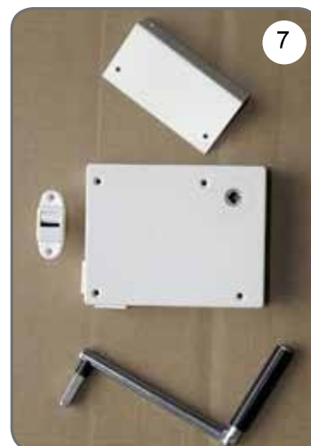
Kaseta z przekładnią na taśmę (pasek), płytka do mocowania kasety, prowadnica taśmy (paska), korba [7].