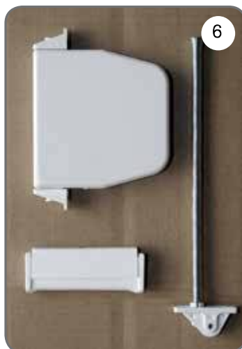
Zwijacz na linkę, prowadnica linki, uchwyt linki [6].