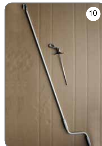
Korba, przegub Cardana 45° lub 90° z uchem [10].