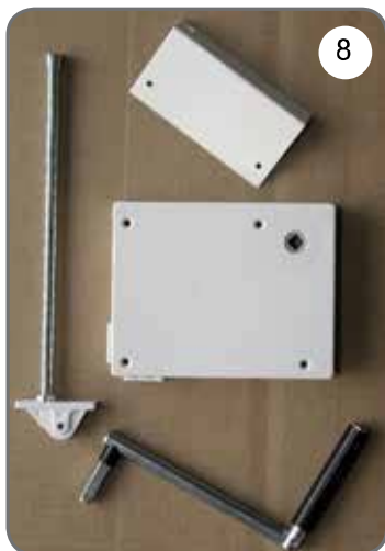
Kaseta z przekładnią na linkę, płytka do mocowania kasety, prowadnica linki, korba [8].