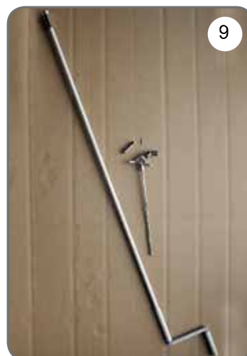
Korba, przegub Cardana 45° lub 90° z zaczepem dzwinkowym [9].