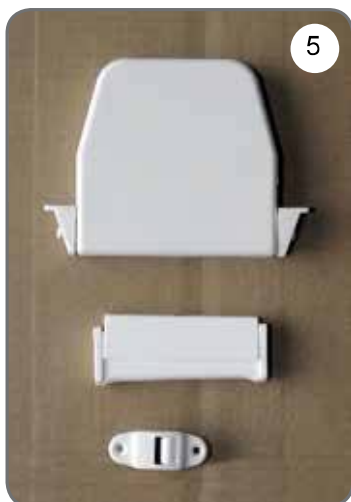
Zwijacz na taśmę (pasek), prowadnica taśmy (paska), uchwyt taśmy (paska) [5].

b) Rodzaje stosowanych napędów ręcznych (opcje):